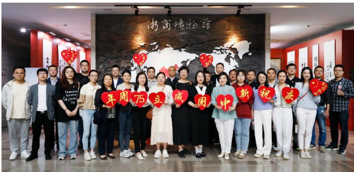
附件三：部分活动照片